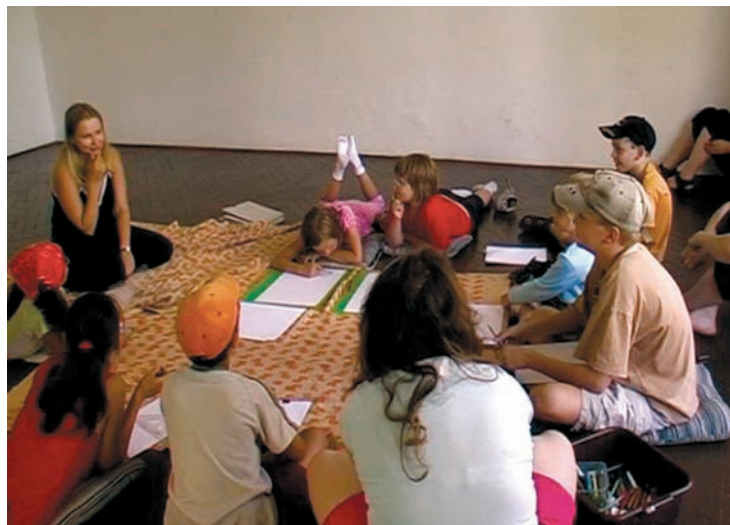
Workshop v rámci výstavy Těm, kdo se tady nenarodili , Galerie Sokolská 26, Ostrava 2008, Video dokumentace, 17:10 (video still)