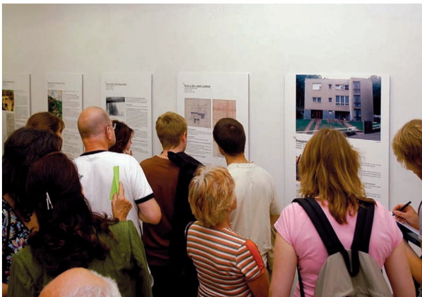
Slavné brněnské vily II., 2007. Pohled do instalace, Galerie G99, Brno, [archiv Barbory Klímové, foto Michaela Dvořáková]