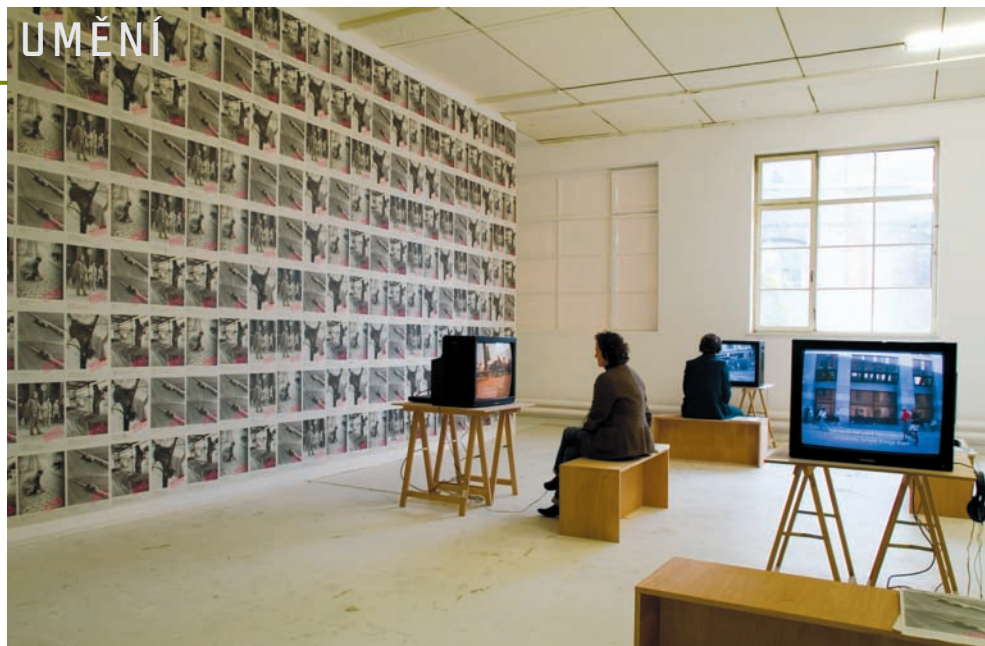
REPLACED - BRNO - 2006. Pohled do instalace, Barrack, HISK Antverpy, (archiv Barbory Klímové, foto Dirk Pauwels)

V určitém momentu může být samotný rozhovor – tak jako cokoli jiného – transponovaný do roviny umění. Suchý dokumentární rozhovor může být v určitém případě na místě, stejně jako rozhovory, jež jsou nějakým způsobem posunuté. Třeba v rámci projektu Těm, kdo se tady nenarodili? (2007), kde jsem se zabývala vztahem umělecké scény k Olomouci, jsem lidi z olomoucké kulturní sféry vyzvala, aby se mnou jednotlivě mlčky prošli svou oblíbenou trasu městem. Vět-